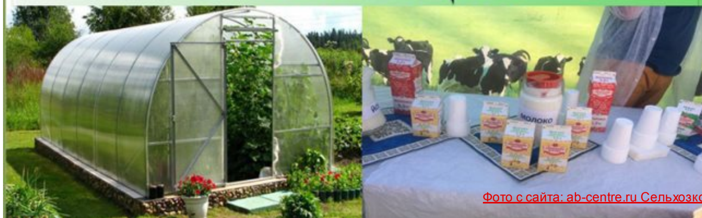
Сельхозкооперация